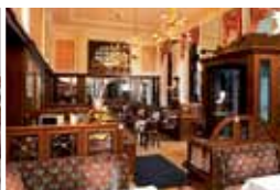
Café Mozart bei der Oper 1., Albertinaplatz 2