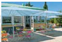
Jausen Station 13., im Schlosspark Schönbrunn