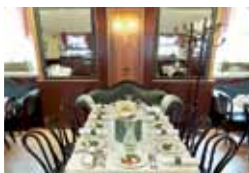
Café Residenz 13., beim Schloss Schönbrunn