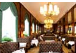
Café Landtmann beim Burgtheater 1., Universitätsring 4

Welcome to our traditional Viennese coffee houses!