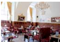
Café Hofburg bei der Michaelerkuppel 1., Innerer Burghof 1