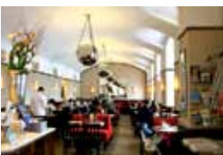
Café Museum beim Karlsplatz 1., Operngasse 7